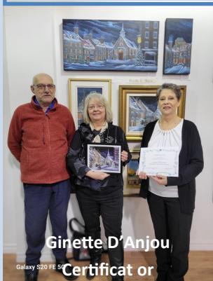
Ginette D'Anjou Certificat or

L'évènement se déroulait cette année dans un contexte économique difficile où la hausse des taux d'intérêt et le très grand nombre de grévistes limitaient de beaucoup les achats de cadeaux, et ce, dans l'ensemble des boutiques du centre commercial. Malgré tout, plus de 9 tableaux et/ou reproductions ont trouvé preneurs, sans oublier des nombreuses cartes et signets. Merci aux artistes, à tous les bénévoles pour leur implication et félicitations aux heureux gagnants de coups de cœur du public.