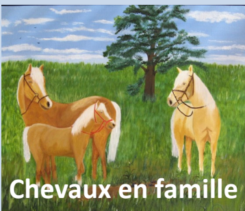
Chevaux en famille