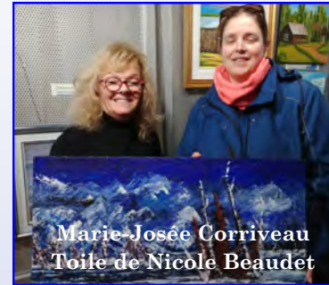
Marie-Josée Corriveau Toile de Nicole Beaudet