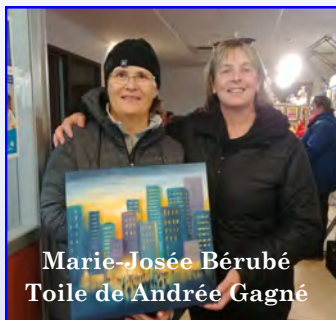
Marie-Josée Bérubé Toile de Andrée Gagné