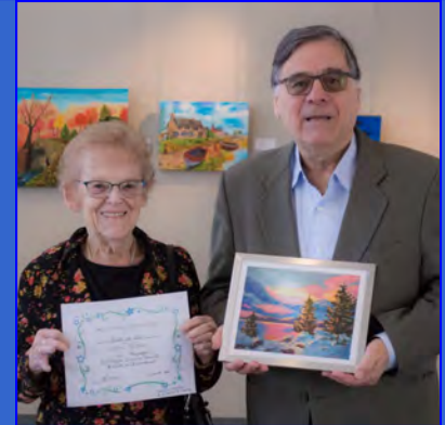
Paul Rivard « Hiver de rêve » de Janine Poitras