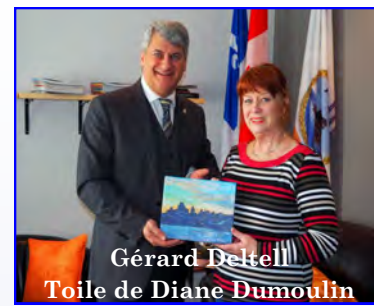
Gérard Betteff Toile de Diane Dumoulin