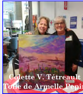
Colette V. Tétreault Toile de Armelle Pepin