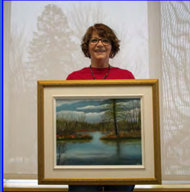
Celine Dumas « Quiétude » de Andrée Nadeau